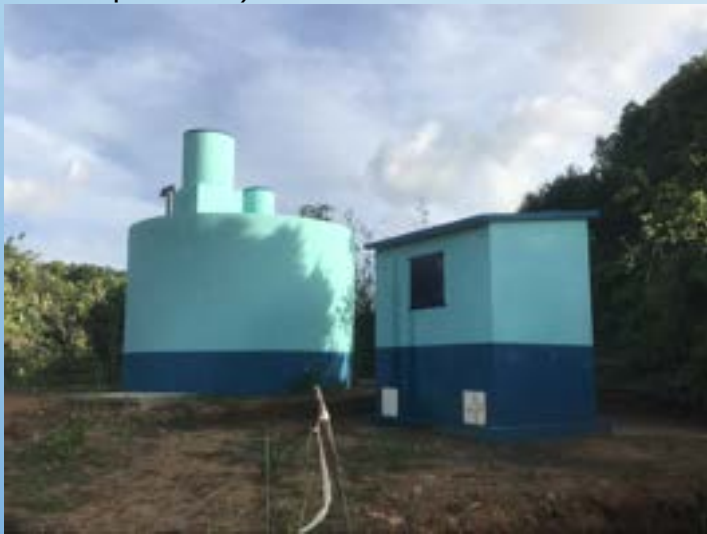
Les installations du 2eme réseau avec le GRET