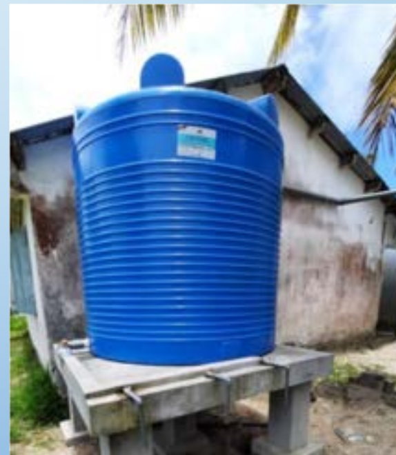
Cuve de 2500 L de récupération d'eau de pluie

Faire en sorte que le programme se poursuive, géré en totale autonomie humaine et financière par les autorités locales scolaires et de santé.