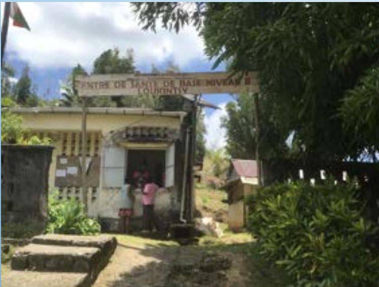
Centre de Santé de Loukinsty, site pilote pour la vente d'hypochlorite à la communauté, la désinfection des tables d'accouchement, du matériel et linge médical.