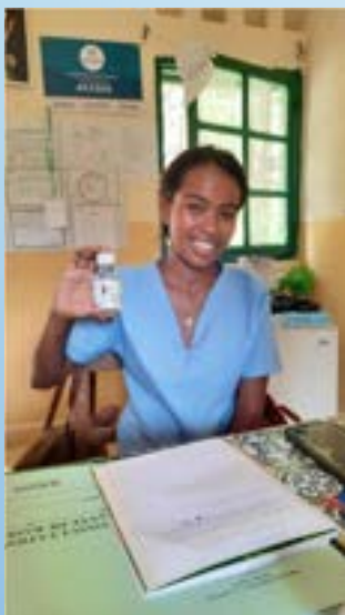
Flacon de 100 ml de chlore vendu par les CSB 500 ariarys (0,10 euros) qui permet de potabiliser 330 L d'eau. 1 bouchon = 1 jerrican de 20L

-Nous avons doté les Centres de Santé de proximité de dispositifs « Wata », permettant de produire des dosettes d'hypochlorite de sodium, destinées à potabiliser l'eau du foyer familial. Environ 500 familles à ce jour adhèrent à ce programme.