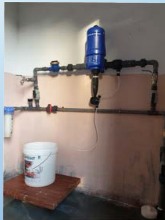
Le système de chloration du 1 er réseau avec le GRET

-Nous avons financé des installations de potabilisation de petits réseaux d'adduction d'eau réalisés par l'ONG GRET, dans des zones non couvertes par la compagnie nationale JIRAMA. Un premier réseau alimente désormais 105 familles (530 personnes), 2 écoles et un Centre de santé. Deux autres réseaux sont en cours de réalisation et alimenteront 400 familles, 3 établissements scolaires et un Centre de santé (soit 1000 personnes au total).